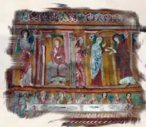
Oratorio di San Pellegrino a Bominaco (AQ)