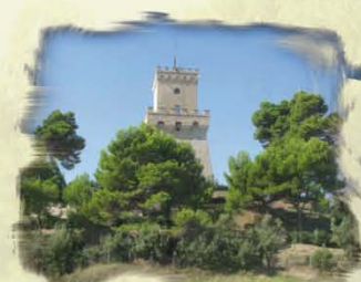
La Torre Cerrano a Pineto (TE)