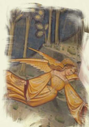
Santa Maria in Piano a Loreto Aprutino (PE)