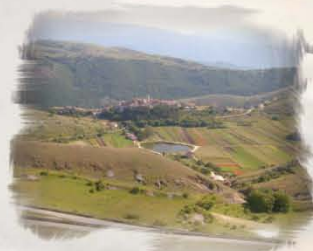
Borgo di Santo Stefano di Sessanio (AQ)

Partendo dalla maestosa Cattedrale di San Giustino, si passerà tra le vie di quest'antichissima città alla scoperta della sua storia millenaria. Si seguirà un appassionante percorso dalla storia romana a quella medievale, dall'arte romanica a quella barocca. I monumenti e le strade di Chieti conservano e racchiudono tutto il percorso della storia dell'uomo e le opere di periodi distanti tra loro interi millenni, che possono essere scoperte a pochi metri di distanza l'una dall'altra.