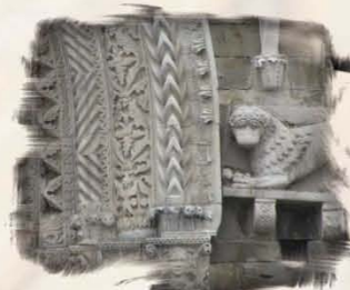
Decorazione scultorea nel portale della Cattedrale di Atri (TE)