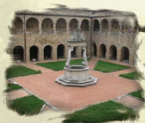
Chiostro della Cattedrale di Atri (TE)