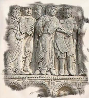
Bassorilievo nel portale di San Giovanni in Venere a Fossacesia (CH)