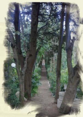
Parco dei Ligustri a Loreto Aprutino (PE)

Si ringraziano per la collaborazione i Comuni, gli Enti, e tutti coloro che con passione hanno contribuito alla riuscita di questa manifestazione